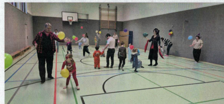
Auch in diesem Jahr hatten nicht nur die Kinder viel Freude und Spaß bei der Karnevalsturnstunde ☺